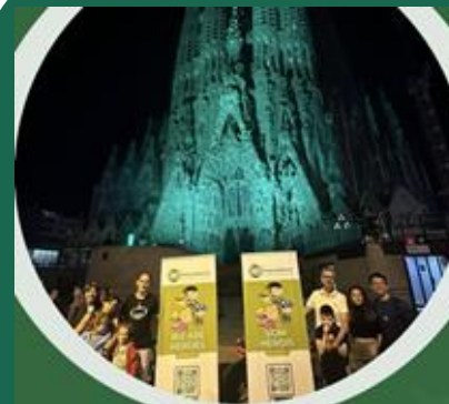
SAGRADA FAMILIA (Barcelona)