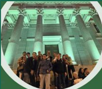
CONGRESO DE LOS DIPUTADOS (Madrid)

El 22 de Octubre celebramos el Día Internacional del Síndrome Phelan-McDermid , iluminando de color verde más de 70 lugares y edificios en toda España.